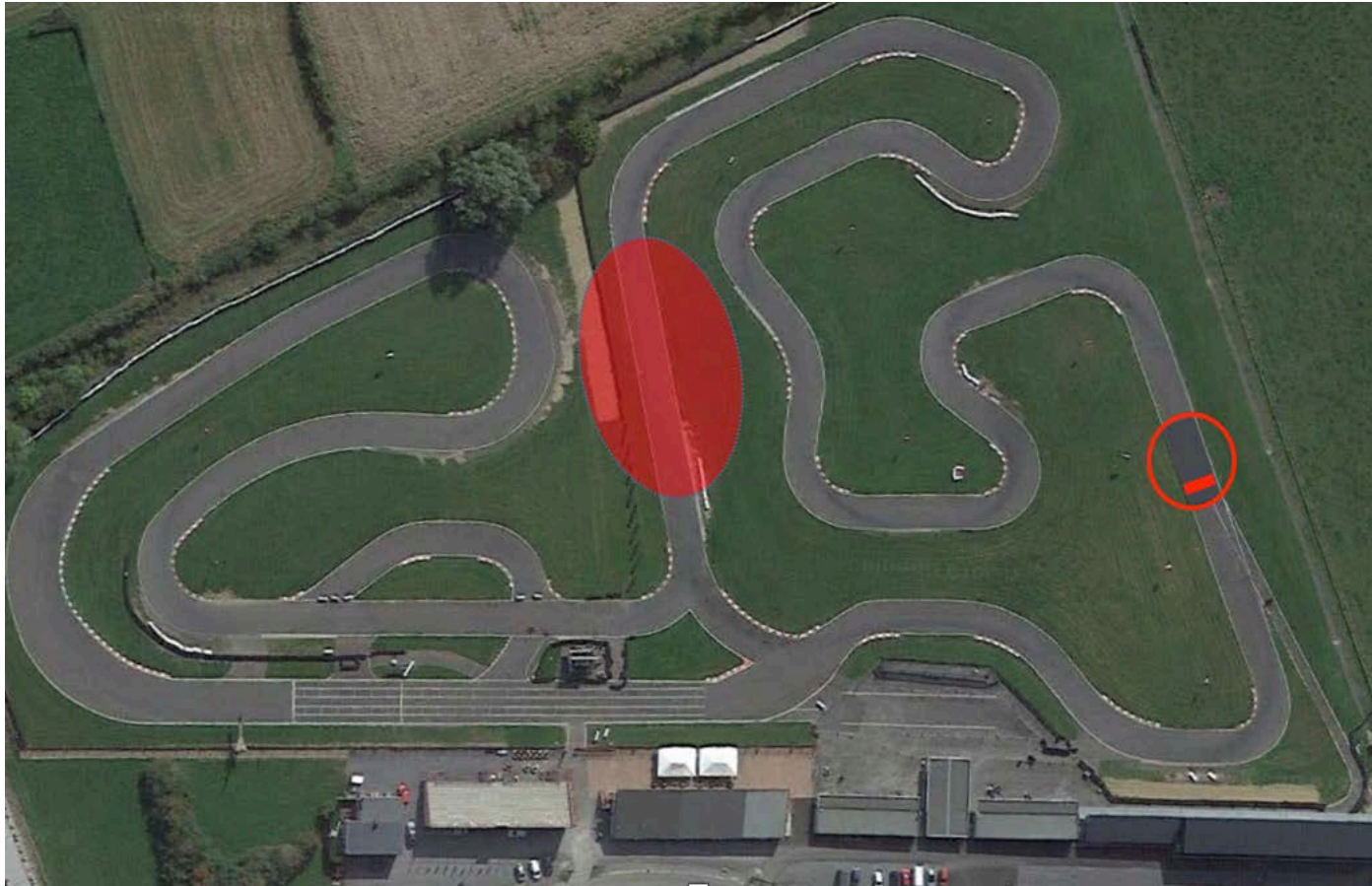
Afbeelding 2. Bovenaanzicht Mariembourg: Opwarmronde, formatieronde en formatielijn