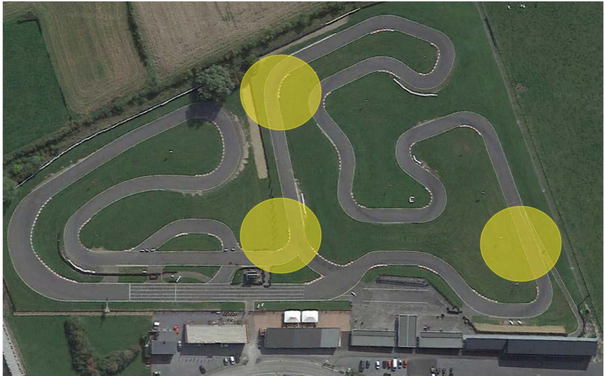
Afbeelding 3: Bovenaanzicht Mariembourg: Extra opletten en snelheid verminderen bij een gele vlag situatie